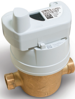
Aquadis+ ausgestattet mit dem Cyble 5 Modul